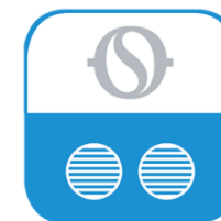
Olimpia Splendid Unico

De geluidsproductie is zonder meer bescheiden en de bediening is eenvoudig en logisch. Naast de bijgeleverde functionele afstandsbediening kan de Unico Tower tegen meerprijs, net als alle andere Unico modellen overigens, worden bediend middels de (gratis te downloaden) Olympia Splendid App.